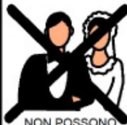
NON POSSONO SPOSARSI