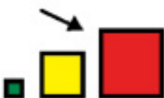
E DI GRANDI