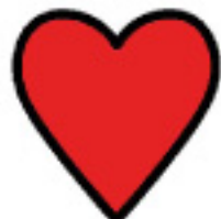
LA AMA LOSTESSO