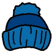
CAPPELLO DI LANA