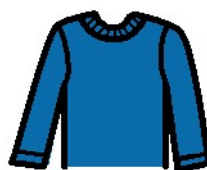
MAGLIA MANICHE LUNGHE