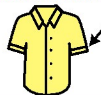
CAMICIA A MANICHE CORTE